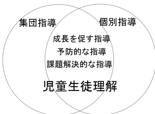
【図】 集団指導と個別指導の指導原理