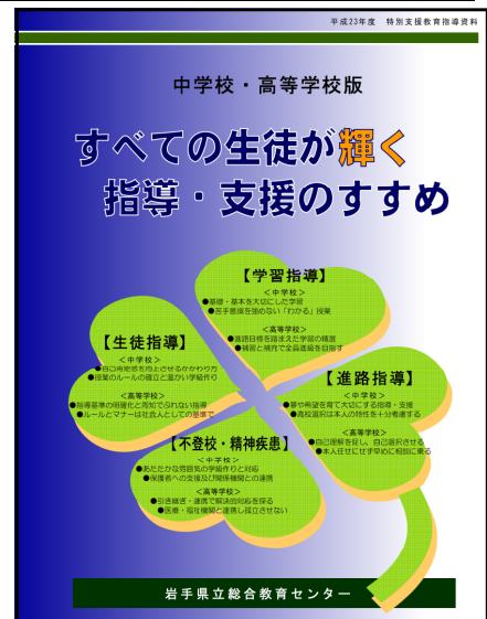
研修資料「理解編」 「中学校・高等学校版 すべての生徒が輝く指導・支援のすすめ」表紙

研修資料「理解編」と「活用編」の有効性と、改善の視点を明らかにするために、研究協力校の教員及び研究協力員へのアンケート調査を行いました。この結果から、中学校及び高等学校の生徒への適切な指導及び必要な支援に有効であるという見通しをもつことができました。また、この調査の分析と考察を受け、研修資料「理解編」と「活用編」をそれぞれ修正・改善したものが、「中学校・高等学校版 すべての生徒が輝く指導・支援のすすめ」と「個別の指導計画作成支援ソフト（中学校・高等学校版ver. 1）」です。