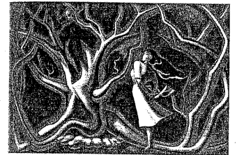
『Night (夜)』 1948