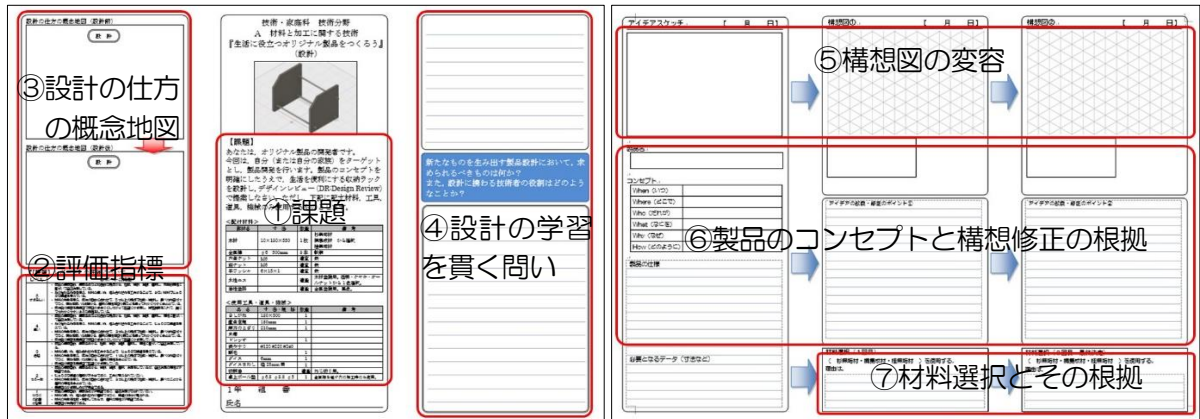
【資料2. OPPシート（設計）表】

題材のはじめに、課題（資料4）と評価指標（資料5）を提示する。この課題は、生徒にとっての制約となり、同時に目的的行動となる。自分の立場、ターゲット設定、配付材料、使用工具などの制約がある中で、現実の世界で役に立つものをつくることは、制約に対処する過程において、創造的な思考力が求められる場面が繰り返し訪れる。評価指標については、生徒と教師で共有し、プロジェクトのチェックリストとしたい。しかし、それが詳細で、具体的になればなるほど、生徒は創造性を発揮することは困難となる。教師の視点の押し付けになりすぎないように気をつけなければならない。