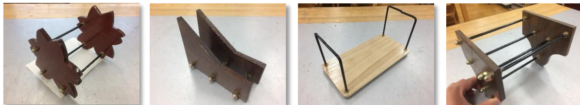
【写真 1. 自由設計による収納ラック作品例】

すと、豊かな発想と想像力で様々なアイデアが表現される。しかし、知識や技能の脆弱さ、生活経験の不足ゆえに見られる問題点も多い。また、「イメージしているものを立体に書き表すことができない」といった課題も見えてくる。「立体を図に書き表せるようになりたい」という生徒の願いを実現するために、製図の学習に入ること、生徒自身が「何のために学んでいるのか」という学ぶことの実質的な意味づけや意義を考え、より主体的な学びにつながるものとする。また、自分がつくりたいと思っているものをつくるために、必要な知識を習得し、活用させる場面をつくることで、基礎・基本の大切さ、必要性というものがわかってくる。こうした学習活動を通して、製品開発に携わる技術者の思いや思考に迫り、実生活や実社会と結びつけながら、技術の科学を踏まえた学習を展開し、「学びの本質」に迫りたい。