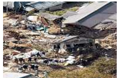
裏山が崩れ、土砂に流された民家で 捜査活動をする自衛隊員ら < 台風被害 >