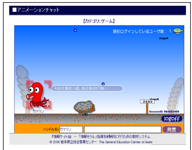
【アニメーションチャット】

左は一般的なチャットです。新しい書き込みがあると古い書き込みは画面に入らなくなり、見えなくなってしまいます。右はアニメーションチャットです。文字だけでなく動きのある画面が特徴で、書き込んだ内容は海底から海面へ移動していきます。どちらも短い時間で書き込みを行わなければならないので、入力スピードが要求されます。掲示板と違って書き込んだ内容にすぐ返事が返ってくるという楽しみがあります。