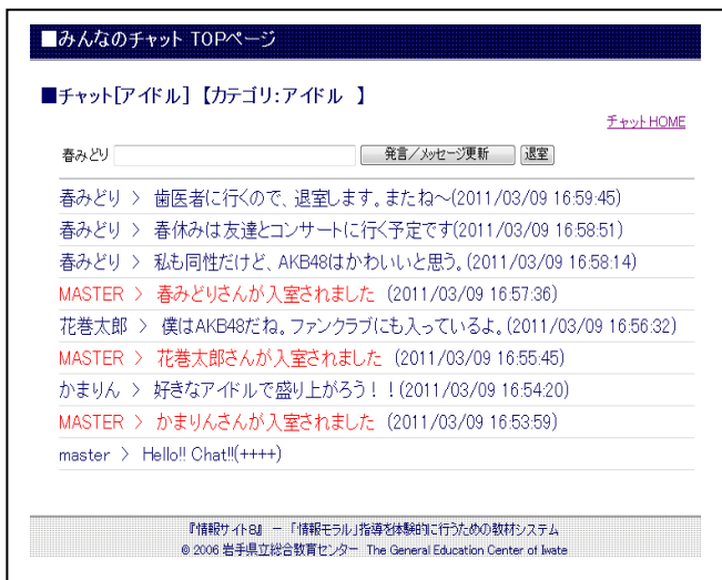
【一般的なチャット】