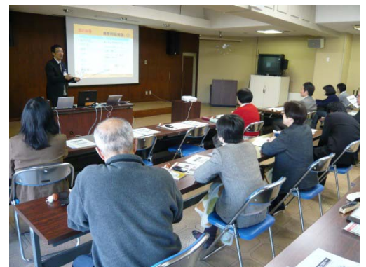
相談員への情報モラル研修