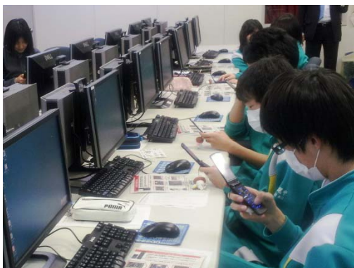
中学校での情報モラル授業