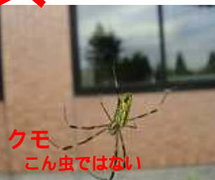
クモ こん虫ではない