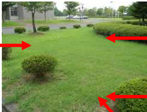
[ 草むら ]

バッタ類の幼虫は6~7月に確認できる。しかし, 体がかなり小さいために, たいへん見つけづらい。夏休み明け, 8月下旬から9月上旬になると, 体も大きくなって見つけやすく, 飼育もしやすくなる。また, 採集可能な昆虫の種類も豊富になっている。よって, 本単元は, 2学期初めに実施することが望ましい。