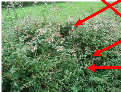
[ 庭木 ]