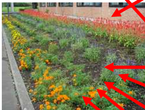
[ 花だん ]