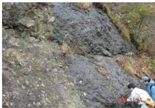
【図3】露頭A (蛋白石を産する安山岩溶岩)

檜ノ木大学士が採集を依頼された蛋白石は、葛丸川一の滝の左岸にそそり立つ三ツ鞍山の麓の部分に観察される(図2 露頭A)。葛丸川の河床にも観察される。安山岩からなる角礫岩状の溶岩である(図3)。火山碎屑岩と呼ばれ、この岩体は葛丸川から三ツ鞍山