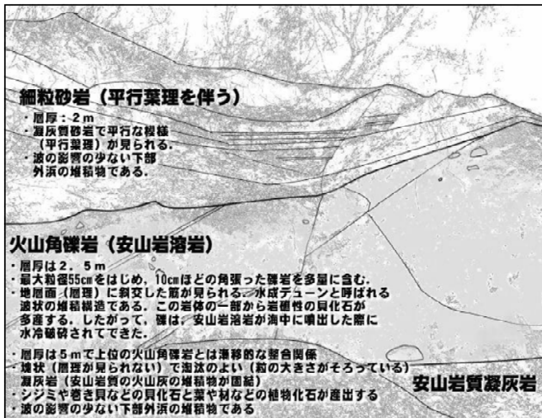
【図10】 露頭Bの露頭スケッチと地質解説