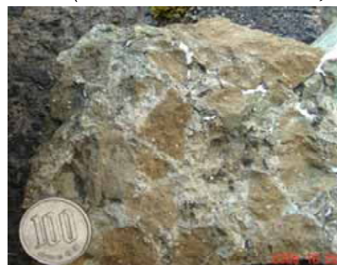
【図4】火山角礫岩と蛋白石の産状

の頂上まで200mの比高を持つ。この火山碎屑岩に伴って、蛋白石、玉髄、瑪瑙、石英(水晶)、輝沸石、方沸石が生じている。