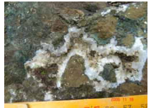
【図6】晶洞での鉱物の産状 （周辺から玉髄，蛋白石，輝沸石）