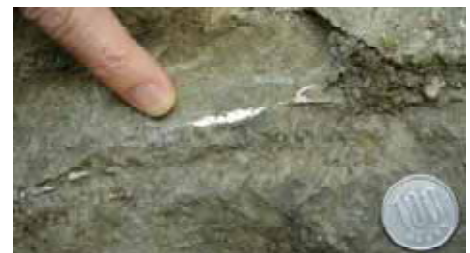
【図7】面状の脈での鉱物の産状 （玉髄から蛋白石への変化）