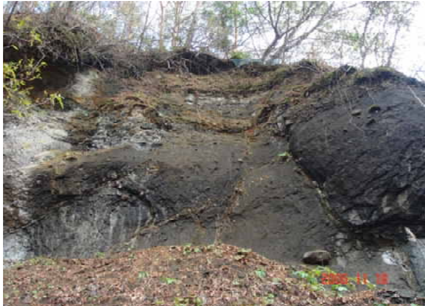
【図9】 露頭Bの写真（小槍沢橋付近）

教師用露頭指導セットは研究協力員の作成した教材を検討して筆者が開発した。専門以外の本研究に参加できなかった教師が野外で指導できるようにするのがねらいである。教師用露頭指導セット（茂庭・照井，2006）とは、野外観察の手引き 露頭写真 スケッチと地質解説 ワークシート（生徒用と教師用）の4つをまとめたものをいう。詳しくは茂庭（2006）を参考にしてもらいたい。