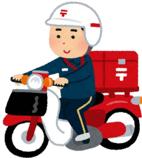
ゆうびんはいたつ