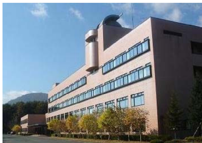
開所20周年を迎えた県立総合教育センター

当センターにおけるそれぞれの仕事が、諸先輩の赫々たる成果を引き継ぎ、更に、岩手の教育界に資する、貢献できるものになっているか否か。日頃自らの課題については、目標を定め、努力し、評価し、次の営為を重ねているところではありますが、こうした機会に改めて自省したいものです。