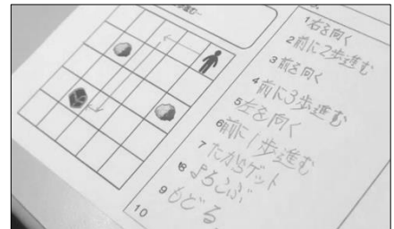
【図1】宝探しゲームの様子

コンピュータを使わずにコンピュータやプログラミングの仕組みや概念を学ぶことができる活動(コンピュータサイエンスアンプラグド)を取り入れました。日常生活を題材にしたり、ゲーム感覚で取り組んだりすることで、アルゴリズムの基礎やパソコン画面の座標(方向)感覚を養うことを目的としました。