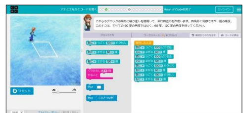
【図2】教材ソフトを利用したプログラミングの様子

プログラミング教材ソフトを利用して、平行四辺形の作図を行いました。ブロックを並べコンピュータに指示を出し、キャラクターの歩く軌跡で作図することができます。