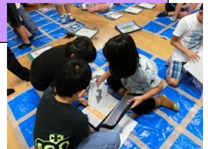
にんげんプログラミング