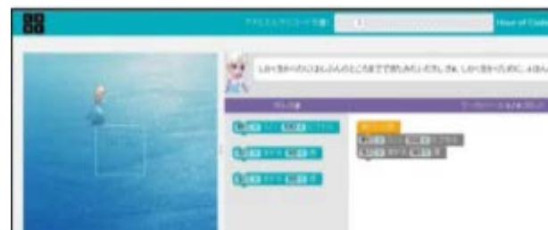
Hour of Code で図形をプログラミング(算数)