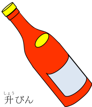
1 升 しょう びん